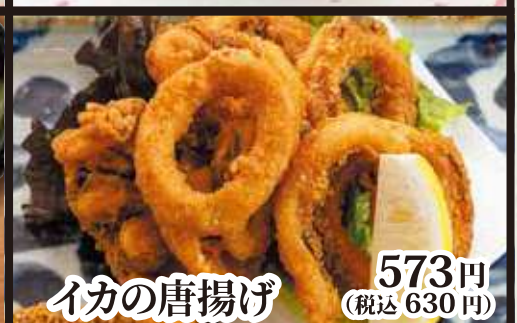
イカの唐揚げ 573円 (税込 630円)