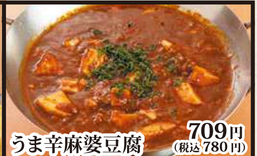
うま辛麻婆豆腐 709円(税込780円)