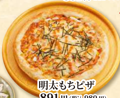
明太もちピザ 891円 (税込 980円)