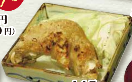
豚足塩焼き 445円 (税込 490円)