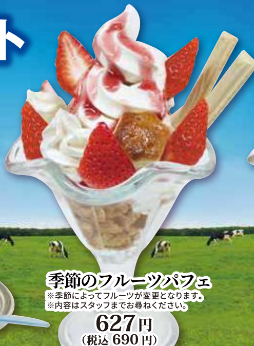
季節のフルーツパフェ ※季節によってフルーツが変更となります。 ※内容はスタッフまでお尋ねください。 627円 (税込 690円)