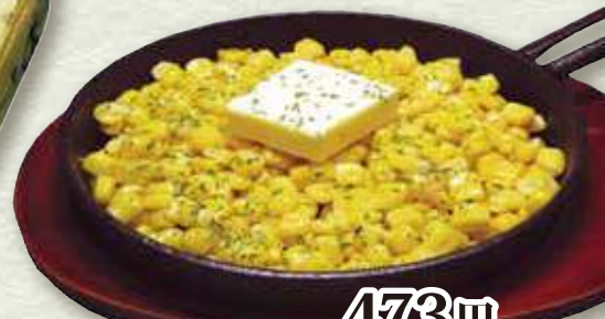
コーンバター 473円 (税込 520円)