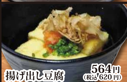
揚げ出し豆腐 564円 (税込 620円)