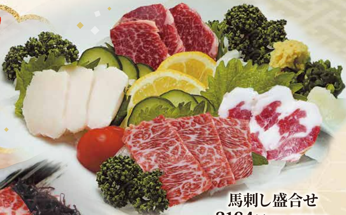
馬刺し盛合せ 2164円(税込 2380円)