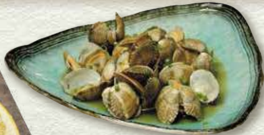
アサリのバター焼き 682円(税込750円)