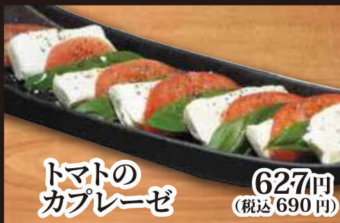
トマトの カプレーゼ 627円(税込690円)