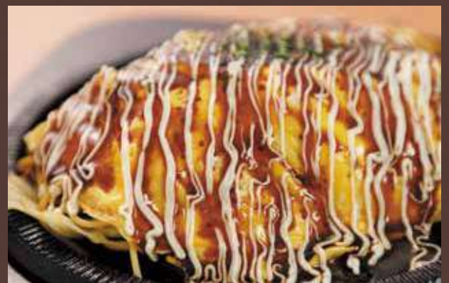
オムそば 727円 (税込 800円)