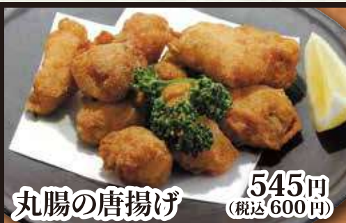
丸腸の唐揚げ 545円 (税込 600円)