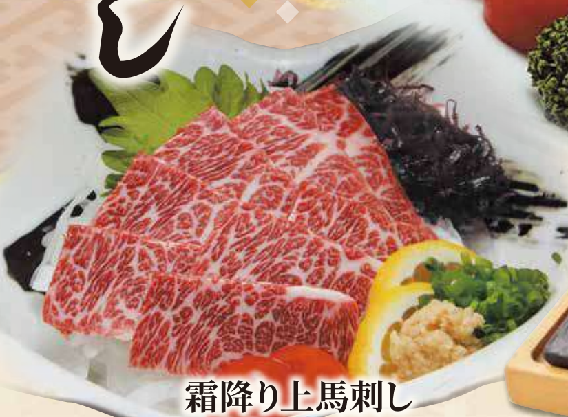
霜降り上馬刺し 2364円(税込 2600円)