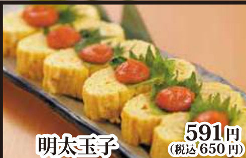
明太玉子 591円(税込650円)