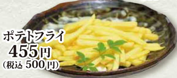
ポテトフライ 455円 (税込 500円)