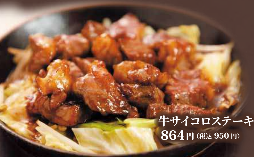
牛サイコロステーキ 864円 (税込 950円)