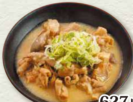
国産ホルモン煮込み 627円 (税込 690円)