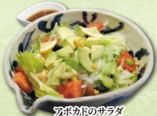
アボカドのサラダ 773円(税込 850円)