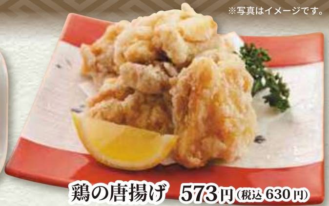
鶏の唐揚げ 573円 (税込 630円)