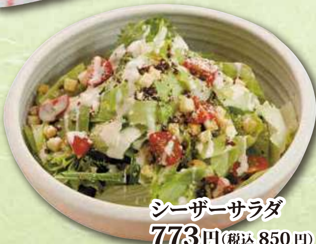
シーザーサラダ 773円(税込 850円)