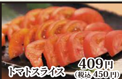
トマトスライス 409円 (税込 450円)