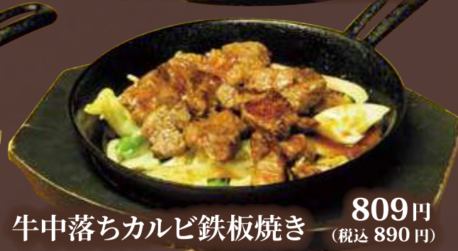
牛中落ちカルビ鉄板焼き 809円 (税込 890円)