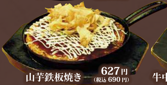
山芋鉄板焼き 627円 (税込 690円)