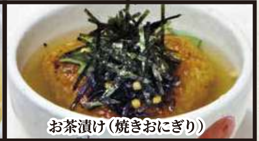
お茶漬け(焼きおにぎり)