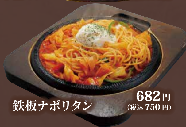
鉄板ナポリタン 682円 (税込 750円)