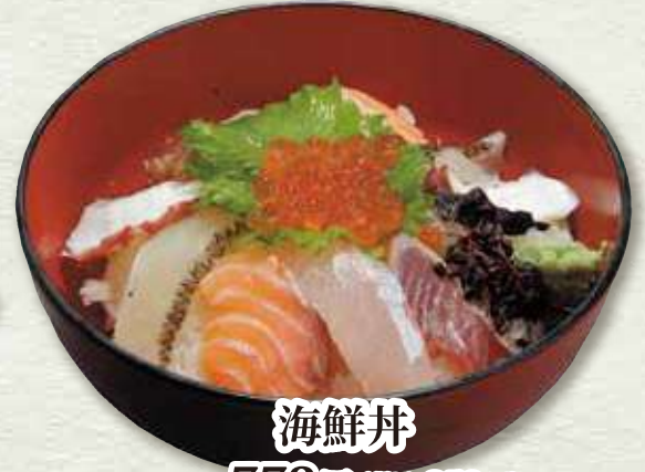
海鮮丼 773円 (税込 850円)