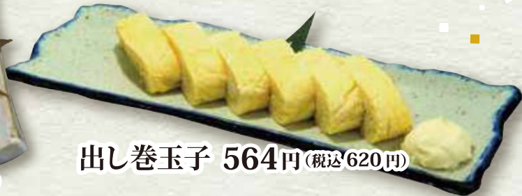
出し巻玉子 564円(税込620円)