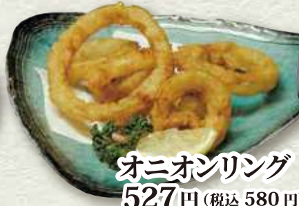
オニオンリング 527円 (税込 580円)