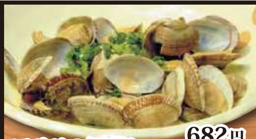
アサリの酒蒸し 682円(税込750円)