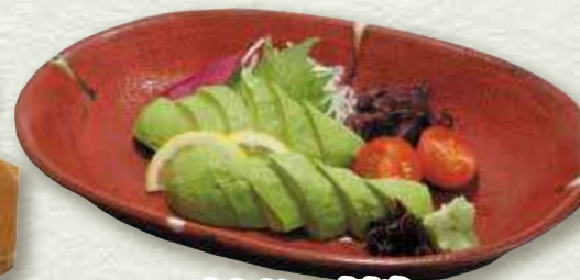
アボカドの刺身 536円(税込590円)