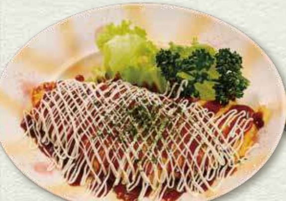
トンペイ焼き 591円(税込650円)