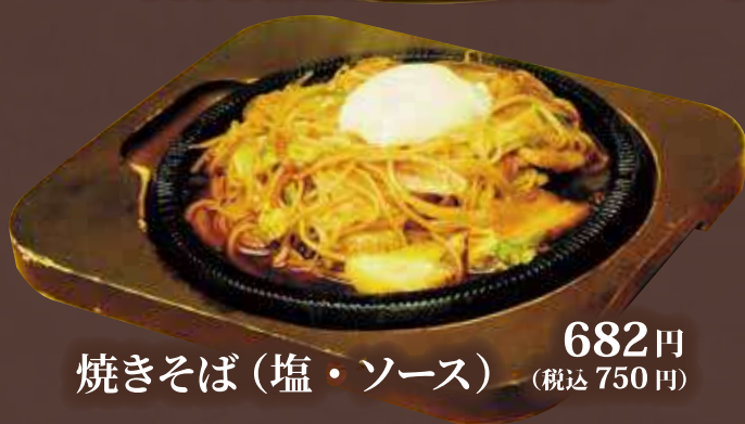
焼きそば (塩・ソース) 682円 (税込 750円)