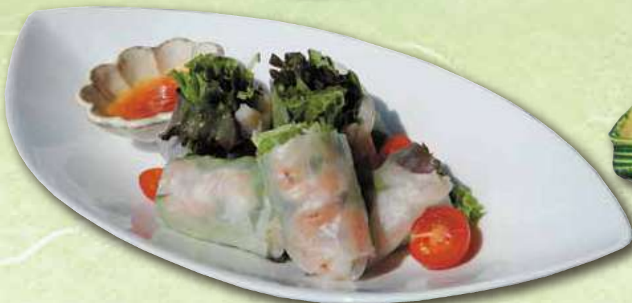
海鮮生春巻き 800円(税込 880円)