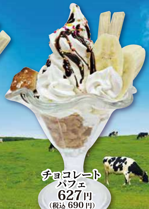
チョコレート パフェ 627円 (税込 690円)