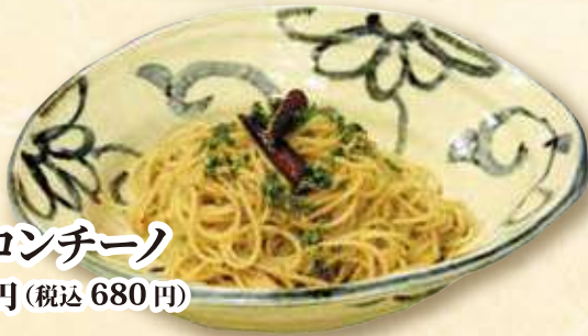
ペペロンチーノ 618円 (税込 680円)