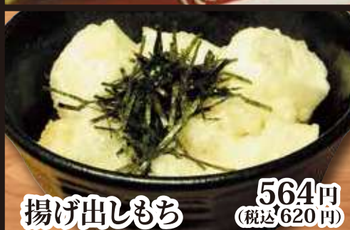
揚げ出しもち 564円 (税込 620円)