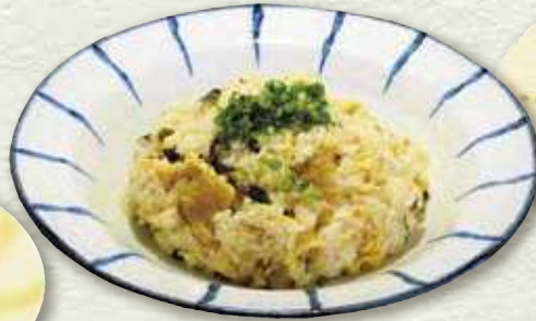
高菜チャーハン 636円 (税込 700円)