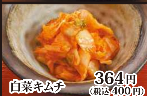
白菜キムチ 364円 (税込 400円)