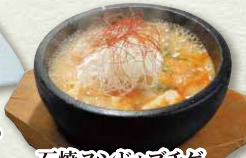
石焼スンドウチゲ 727円(税込800円)