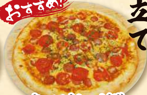
キーマカレーピザ 864円 (税込 950円)