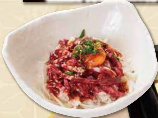
馬のユッケ 1000円(税込 1100円)