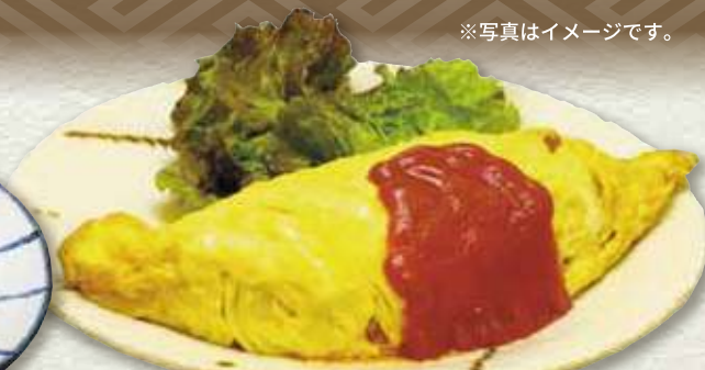
オムライス 709円 (税込 780円)