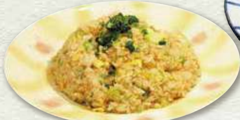
彩りチャーハン 636円 (税込 700円)