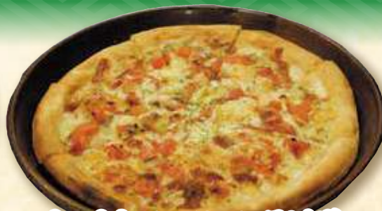
トマトとモッツアレラピザ 891円 (税込 980円)