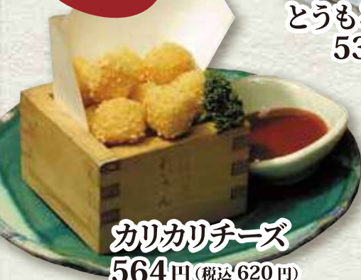
カリカリチーズ 564円 (税込 620円)