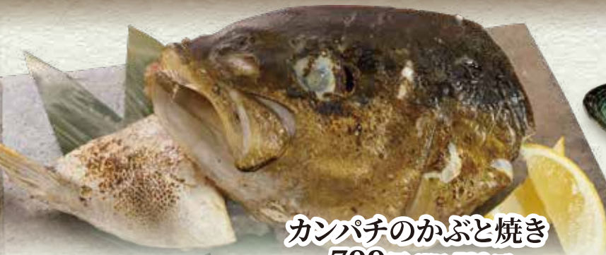
カンパチのかぶと焼き 709円(税込780円)