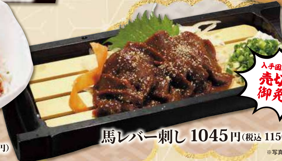
馬レバー刺し 1045円(税込 1150円)