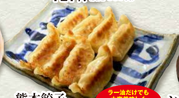
熊本餃子 536円(税込590円)