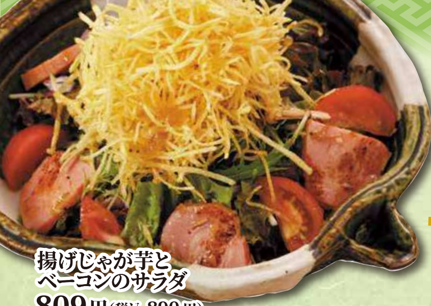
揚げじゃが芋と ベーコンのサラダ 809円(税込 890円)