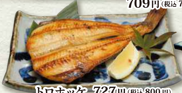
トロホッケ 727円(税込800円)