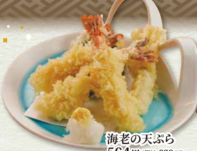
海老の天ぷら 564円 (税込 620円)