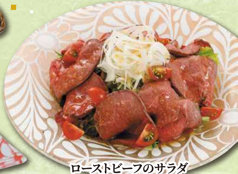
ローストビーフのサラダ 809円(税込 890円)