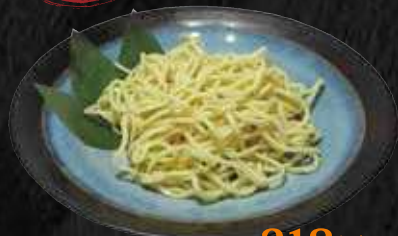
ちゃんぽん麺 318円 (税込 350円)