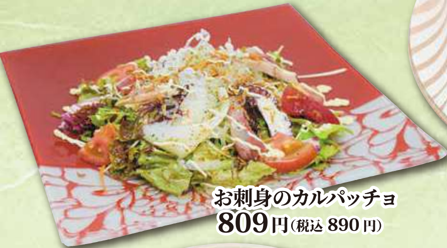
お刺身のカルパッチョ 809円(税込 890円)