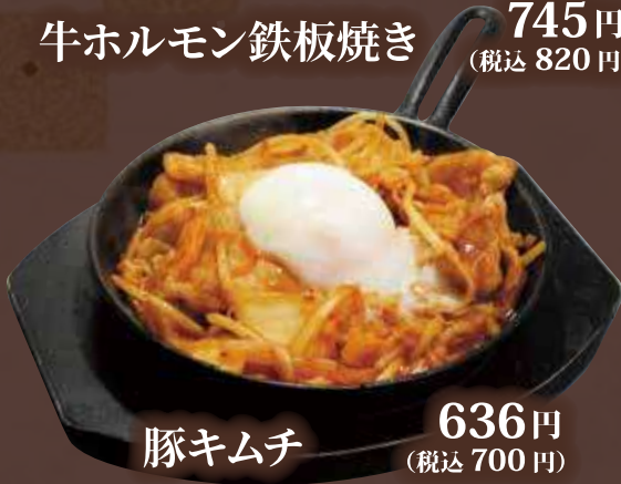
豚キムチ 636円 (税込 700円)