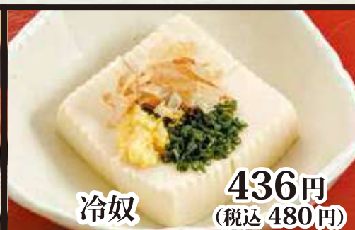
冷奴 436円 (税込 480円)