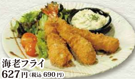
海老フライ 627円 (税込 690円)