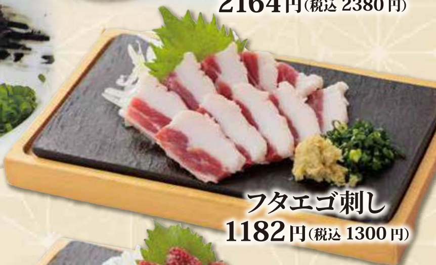
フタエゴ刺し 1182円(税込 1300円)