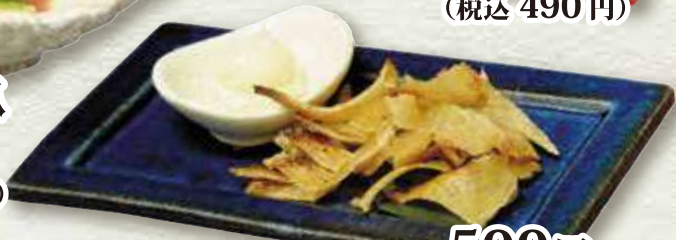
エイヒレの炙り 500円 (税込 550円)