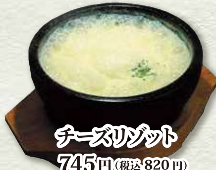
チーズリゾット 745円 (税込 820円)