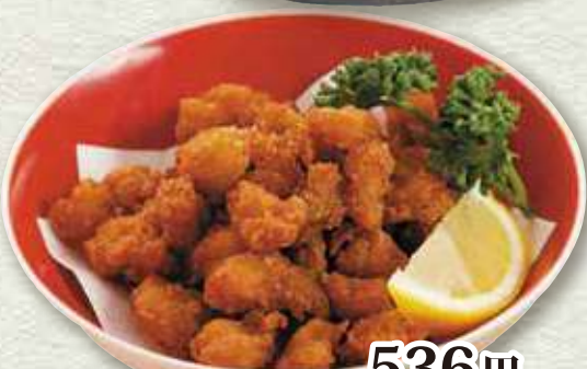
鶏軟骨の唐揚げ 536円 (税込 590円)