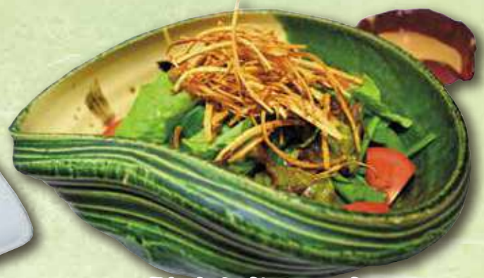
揚げごぼうサラダ 727円(税込 800円)