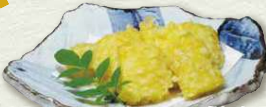
どうもろこしのビール揚げ 536円 (税込 590円)