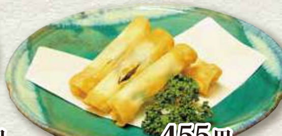
チーズフライ 455円 (税込 500円)