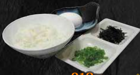
雑炊セット 318円 (税込 350円)