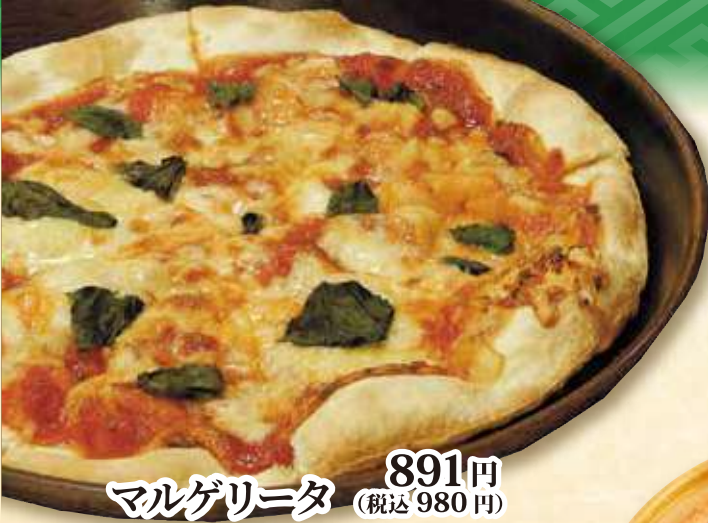
マルゲリータ 891円 (税込 980円)