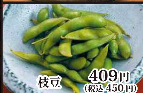
枝豆 409円 (税込 450円)