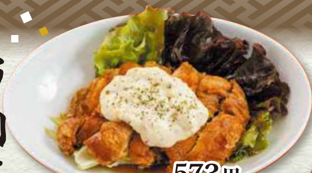
チキン南蛮 573円 (税込 630円)