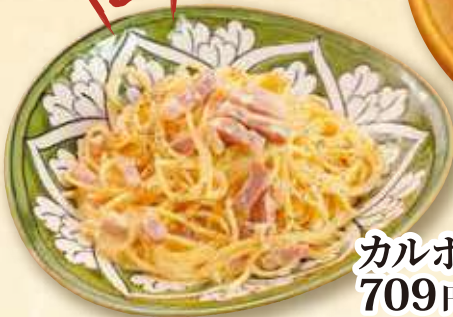
カルボナーラ 709円 (税込 780円)