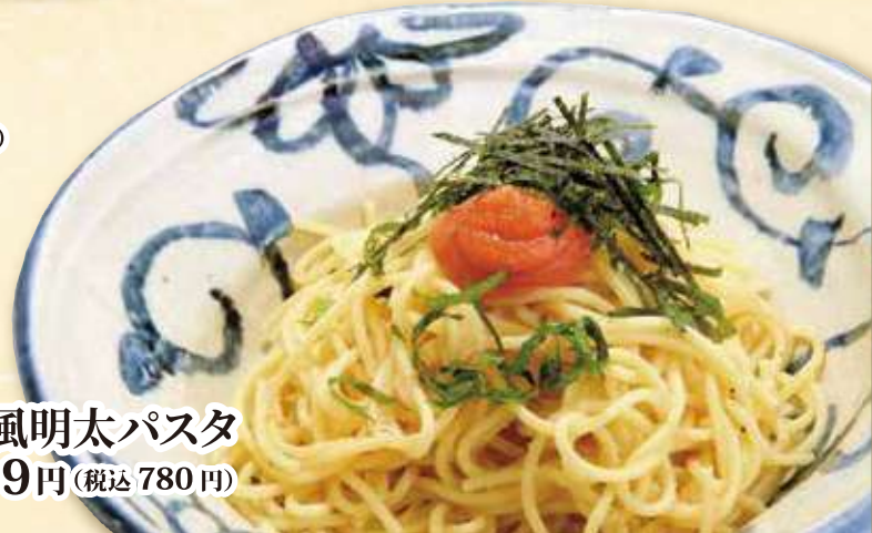
和風明太パスタ 709円 (税込 780円)