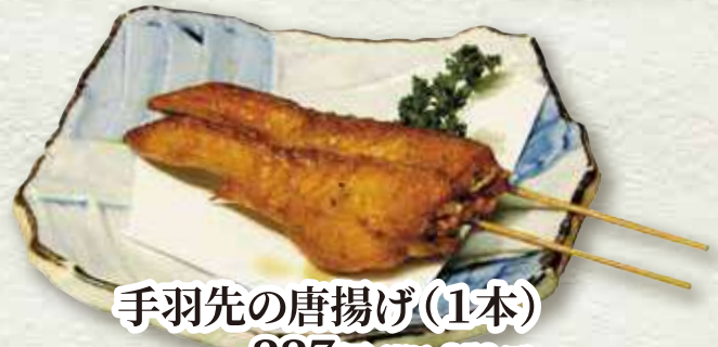
手羽先の唐揚げ(1本) 227円 (税込 250円)