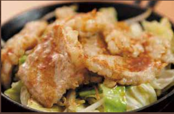
牛ホルモン鉄板焼き 745円 (税込 820円)