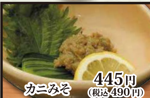
カニみそ 445円 (税込 490円)