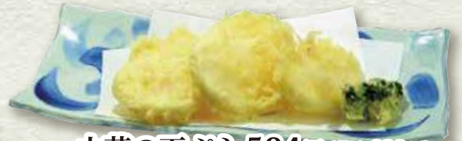
山芋の天ぷら 564円 (税込 620円)