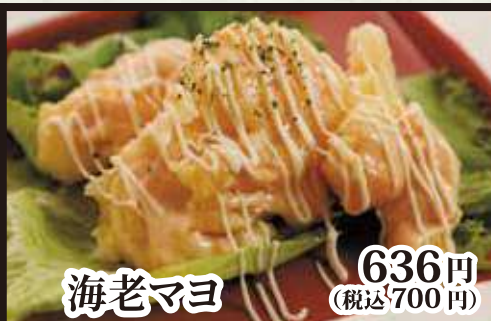
海老マヨ 636円 (税込 700円)