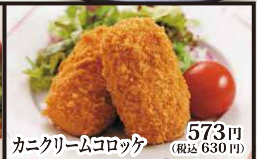
カニクリームコロッケ 573円 (税込 630円)