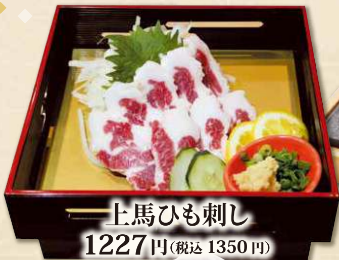
上馬ひも刺し 1227円(税込 1350円)