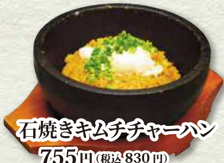
石焼きキムチチャーハン 755円 (税込 830円)