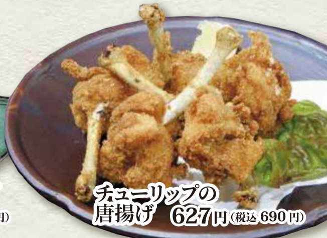
チュニリップの唐揚げ 627円 (税込 690円)