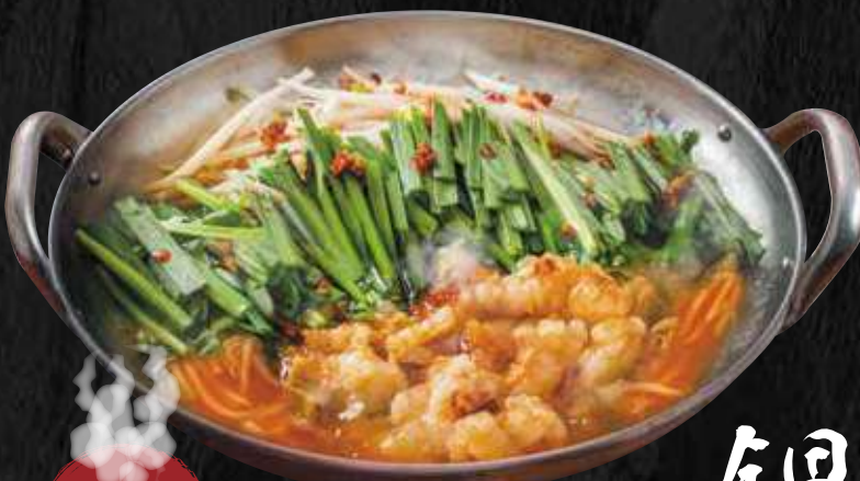
味噌キムチ鍋 (1人前) 773円 (税込 850円) ※写真は1.5人前です。