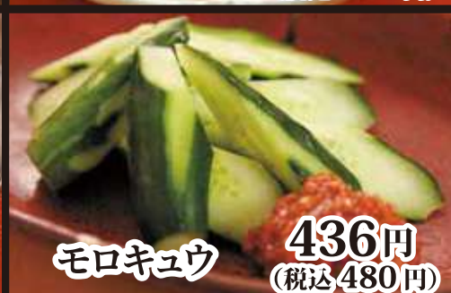
モロキュウ 436円 (税込 480円)