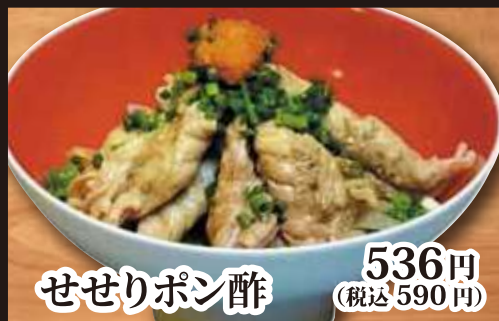
せせりポン酢 536円(税込590円)