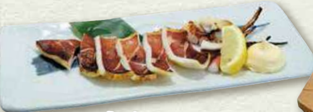
イカの一夜干し 545円(税込600円)