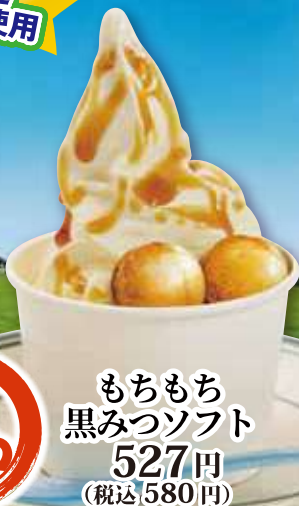
もちもち 黒みつソフト 527円 (税込 580円)