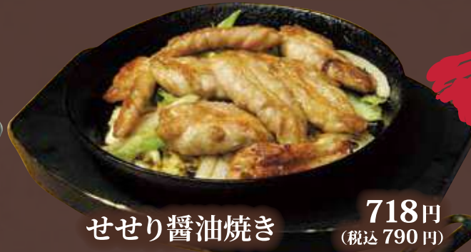
せせり醤油焼き 718円 (税込 790円)