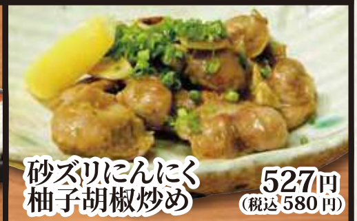
砂ズリにんにく 柚子胡椒炒め 527円(税込580円)