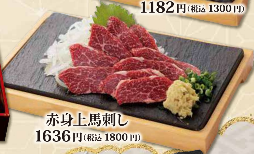
赤身上馬刺し 1636円(税込 1800円)